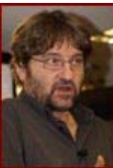
Bozóki András Kulturális miniszter 2005-2006 CEU Politikatudományi Tanszék – docens